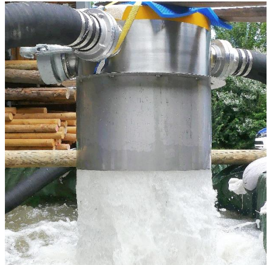
Foto: Abflussbild bei 6.000 L/Min

* Auf Wunsch kann auch in V4A -Qualität gefertigt werden.